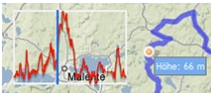
Abbildung 2: Höhenprofil

Wenn Sie das Höhenprofil mit der Maus überfahren, wird Ihnen die Höhe an dem entsprechenden Streckenpunkt angezeigt.