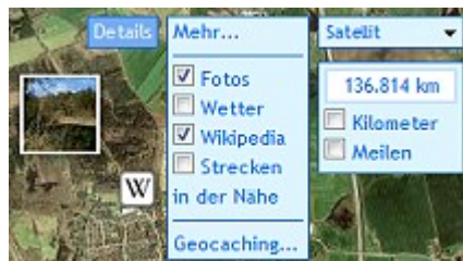
Abbildung 3: Weitere Anzeigoptionen

Wenn Sie das Höhenprofil mit der Maus überfahren, wird Ihnen die Höhe an dem entsprechenden Streckenpunkt angezeigt.