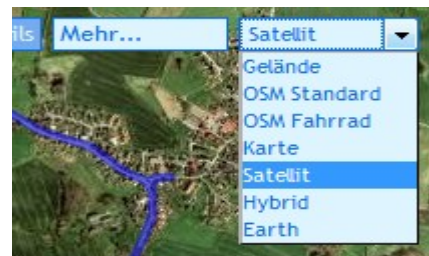
Abbildung 4: Darstellungsoptionen

Details bringt Sie direkt zur entsprechenden Streckenseite bei gpsies.com